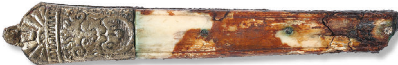
SL. 33. KOŠTANA DRŠKA NOŽA