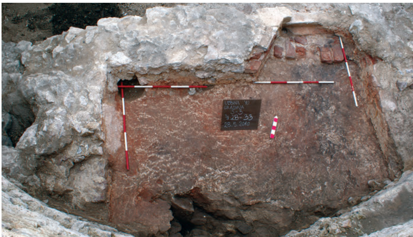
SL. 7. PROSTORIJA 1 U KULI

S obzirom da je ostao očuvan tek zidni plašt, bez vanjskog lica kao i sama visina zidova, ne dozvoljavaju nam odrediti je li kula bila cilindrična ili stožasta. No prema uzusima tadašnjeg vremena, kao i brojnim