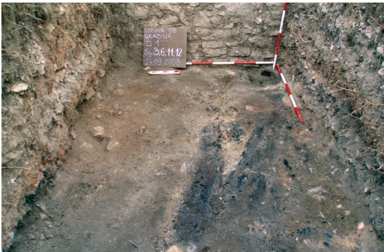
SL. 10. OSTACI DRVENIH GREDA OPHODA

Graditelji su vješto koristili prirodnu liticu na kojoj je kula podignuta, pa su vidljivi i dijelovi kamena živca, obrađenog i interpoliranog u temelje ili