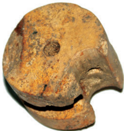
SL. 35. ORAH SAMOSTRIJELA

Nalazi hladnog i vatrenog oružja svjedoče o načinu ratovanja i sukobima ili napadima na utvrdu. Pronađen je veći broj vrhova strelica za samostrijel te koštani orasi samostrijela koji su služili za zatezanje tetive, odnosno luka. Od 13. do 15. st. vrhunac je njihove upotrebe, kada se koriste manji pješачki uz one veće tvrđavske. Na jednom udbinskom primjerku urezan je i broj 14 kao moguća oznaka redoslijeda ili pripadnosti određenom primjerku.