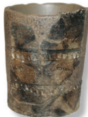
SL. 20. DIO SREDNJOVJEKOVNE KERAMIČKE ČAŠE

Kuhinjskom posuđu pripadaju lonci i čupovi koji su služili za pripremanje i čuvanje hrane. Jednostavnih su oblika, rađeni na ručnom kolu, od gline svijetle