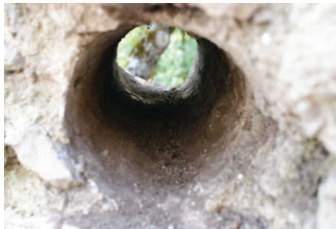
SL. 9. VENTILACIJSKI OTVORI

Nutarnji promjer kule iznosi 6,86 m, odnosno 7,37 m, dok debljina zida iznosi u prosjeku 2,40 m. Lice zida je građeno kamenom lomljenjakom u horizontalnim redovima što je odlika gradnje 14. st., premda podzid kule ima obilježja gotičke gradnje 15. st.