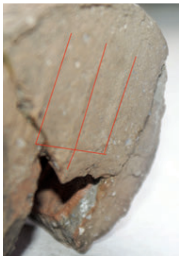
SL. 21. OZNAKA NA DNU RECIPIJENTA

blago trbušasto oblikovanog tijela (tipa Kragen). Ove su čaše u uporabi tijekom 15. st. Ukrašavane su žlijebljenjem, urezivanjem, ubadanjem, ali i slikanjem crnom bojom.