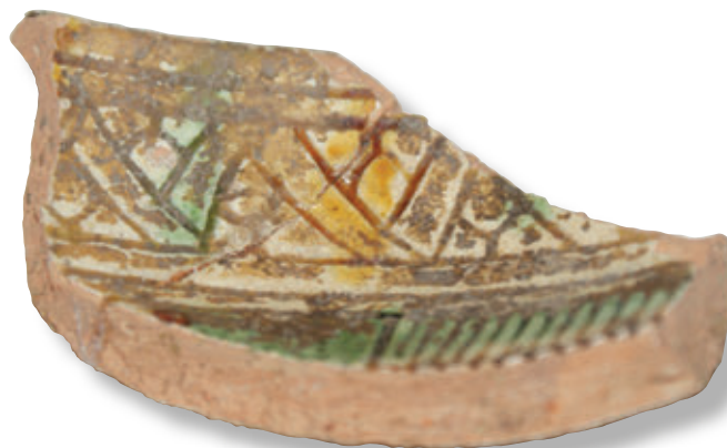
SL. 24. ULOMAK ZDJELICE

I ulomak zdjelice koji svojim obilježjem pripada kasnoj arhaiskoj graviranoj keramici, potječe iz radionica u padanskoj nizini, no tipologija, kronologija i dekoracija su slične i na području Veneta, Emilije-Romagne, Lombardije, istočnog Pijemonta i Friulija. Na udbinskom primjerku, ispod oboda se nalazi profilacija u formi presavijene vrpce koja se kao ukras pojavljuje u posljednjoj četvrtini 15. st. kao odlika renesansne gravirane keramike namijenjene uglavnom bogatijem društvenom sloju.