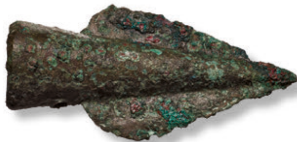
SL. 18. JAPODSKO KOPLJE

Nekropola ovih stanovnika nalazila se vjerojat-no na položaju današnjeg udbinskog parka i dijelom je uništena izgradnjom spomen-kosturnice NOB-a 1955. g.