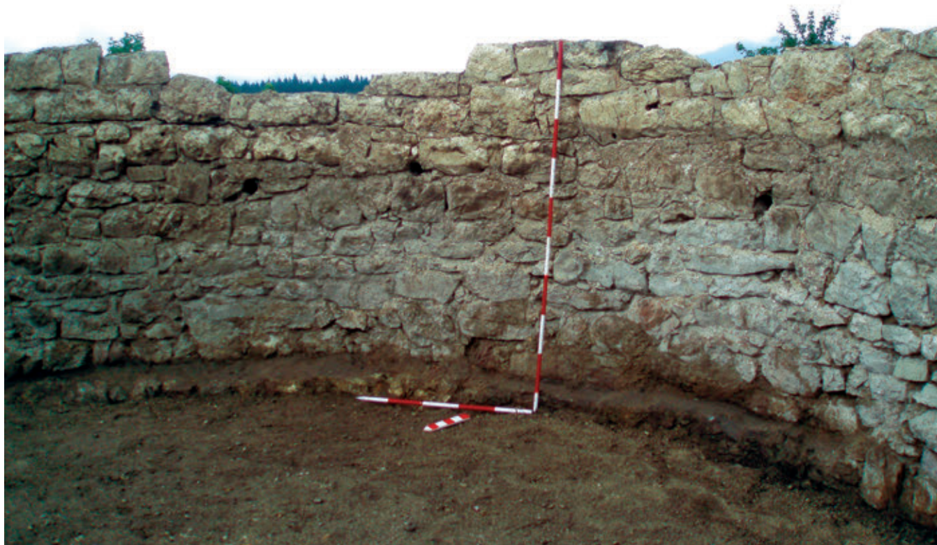
SL. 8. STRUKTURA UNUTARNJEG LICA KULE

analogijama u Hrvatskoj, zasigurno je bila visoka, i prema starijim historiografima „na tri kata“. Ulaz se nalazio na prvom katu, okrenut sjeveru. Za olakšani pristup u kulu, služio je i masivni podzid s kojeg se pružala drvena konstrukcija stepeništa, koju se u slučaju opasnosti moglo lako ukloniti.