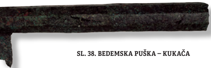
SL. 38. BEDEMSKA PUŠKA – KUKAČA