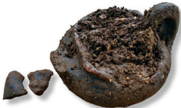
SL. 17. JAPODSKA ŠALICA - KANTAROS

Širilo se i na donje terase, osobito između današ-nje 9. i 12. postaje Križnog puta.