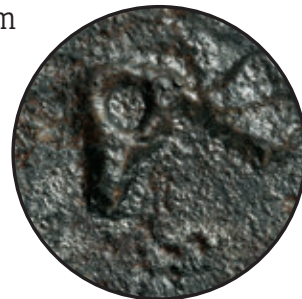
SL.34. RADIONIČKI ŽIG NA SJEČIVU NOŽA

drvenom drškom. Većinom su to dugotrajni oblici od srednjeg do novog vijeka, ali se neki primjerci mogu datirati od 16. do 18. st., osobito koštane drške s dvodijelnom brončanom oplatom i ukrasom lavlje glave.