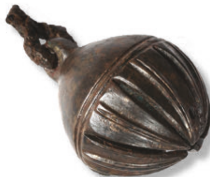
SL. 32. BRONČANI PRAPORAC

Noževi ili pak, samo drške, također su čest nalaz srednjovjekovnih naseobinskih lokaliteta obzirom na višenamjensku funkciju, od jednostavnih kuhinjskih noževa za pripremu hrane, do skupocjenijeg jedaćeg pribora kojim se koristi kasnosrednjovjekovno plemstvo, malih nožića i/ili britvica kao osobnog pribora ili onih koji su korišteni u kožarskom obrtu. Ponekad na sječivu nose radionički žig, a riječ je o jednoreznim noževima ravnog hrpta s koštanom ili