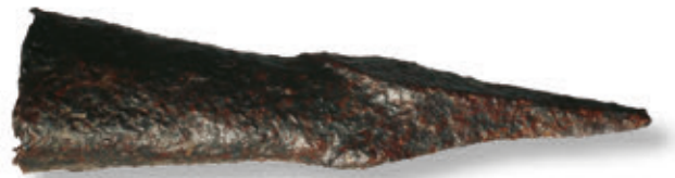
SL. 36. VRH STRELICE ZA SAMOSTRIJEL

(falja). Punjenje je sprijeda, projektilima isprva kamenim, a potom i željeznim. S obzirom na rezultate analize paljevinskog sloja podno kule, najstarije bedemske puške, tzv. kukače nalazimo na Udbini krajem 15. st. Čini ih masivna brončana osmerokutna cijev s kukom kojom se kukača uglavljivala u neku, za tu svrhu predviđenu pukotinu u zidu. Koristila je sustav paljenja barutnog punjenja tinjajućim fitiljem. Tomu treba pridodati i olovna ili željezna puščana zrna koja su lijevana u samom gradu, što nam potvrđuju kameni ili željezni kalupi za lijevanje.