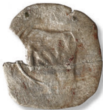
SL. 28. AUSTRIJSKI PFENIG (13. ST. ?)

Pronađeno je tek nekoliko primjeraka novca. Osim tri primjerka rimskog carskog novca 3. i 4. st.