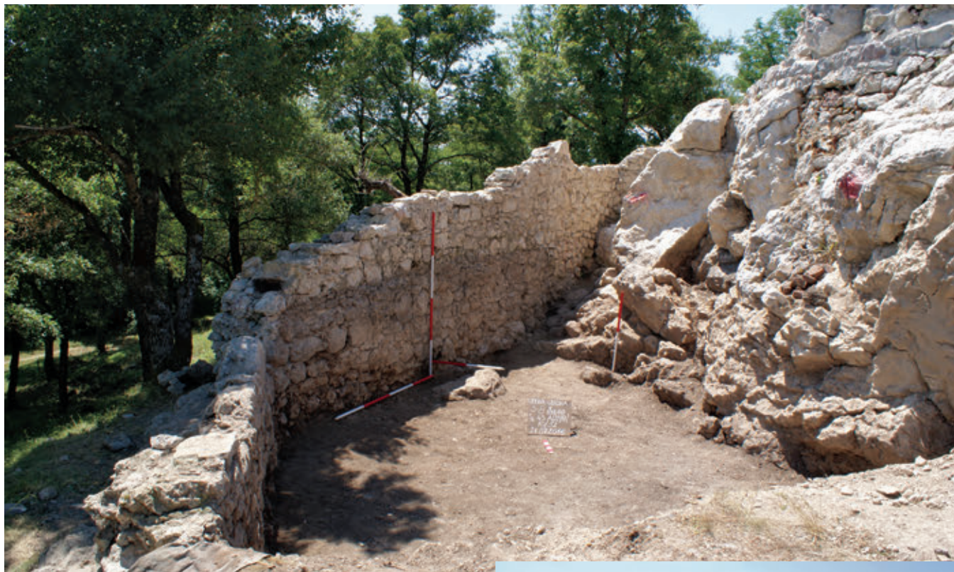
SL. 14. POGLED NA DIO ISTOČNOG BEDEMA

bedema, preduvjet su obrane, bilo da je riječ o dugotrajnoj opsadi ili kratkotrajnim napadima.