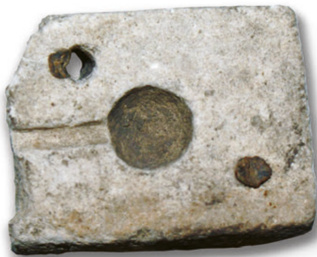
SL. 39. DIO KAMENOG KALUPA ZA LIJEVANJE ZRNA

O prehrani tadašnjih udbinskih stanovnika možemo preliminarno reći da je bila bazirana na bjelanjčevinama, sudeći po većoj količini životinjskih kostiju (govedo, svinja, manje perad, divljač), uz konzumaciju morskih plodova, prema otkrivenim školjkama (dagnje, Petrovo uho ili puzlatka). S obzirom da je ipak riječ o plemićkom zdanju, očekivano je da je prehrana bogatija i raznovrsnija, dok su siromašniji slojevi konzumirali različite kaše, a tomu u prilog ide i nalaz gorenih plodova pšenice i ječma.