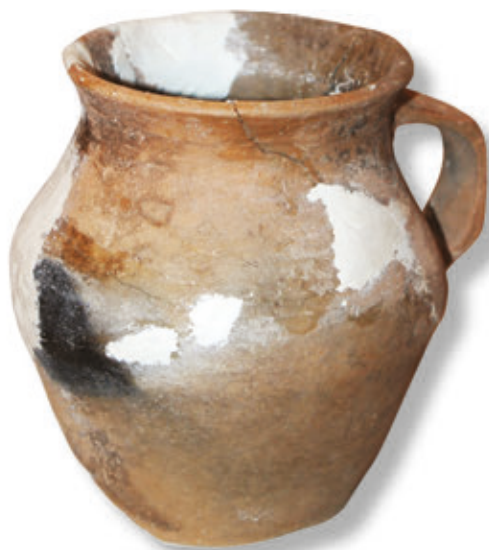
SL. 19. KERAMIČKI SREDNJOVJEKOVNI VRČ

Premda se opeka pri gradnji udbinskih zidova nije koristila u većoj mjeri, prisutna je kao građevinski element podrumske prostorije i u kuli. Ulomak opeke s otiskom pseće šape ciglaste boje, svojom širinom ukazuje na gotičke formate, podjednako kao i nekoliko ulomaka ili cjelovitih opeka od gline tamnocrvene boje s ostacima veziva, čime su bile građene pojedine manje ili pregradne strukture unutar grada.