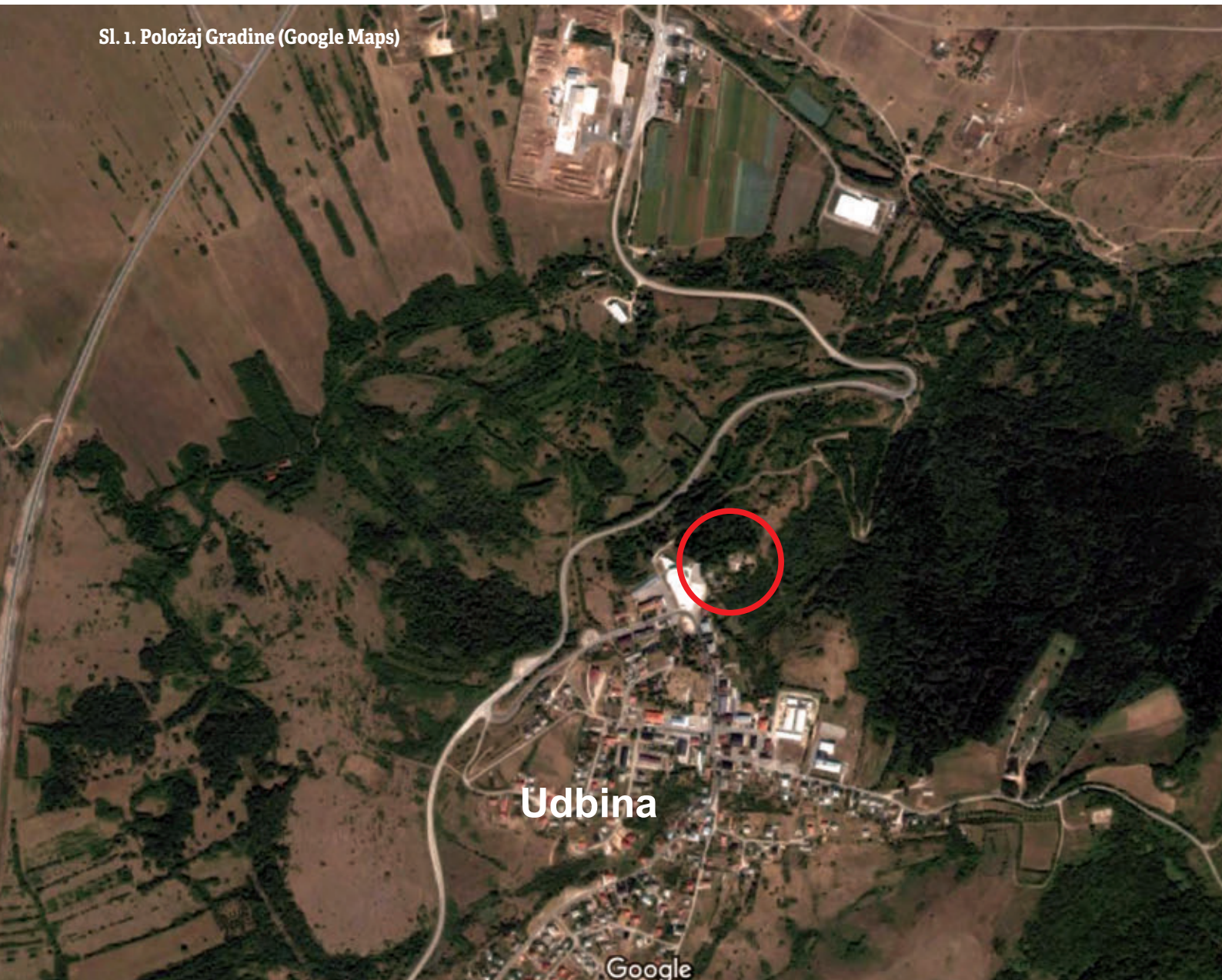
Sl. 1. Položaj Gradine (Google Maps)