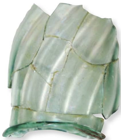
SL. 26. DIO ČAŠE UKRAŠENE VERTIKALNIM REBRENJEM

Ulomci stakla, osim neznatnih primjeraka prozorskih okulusa , pripadaju različitim gotičkim čašama, manje bocama, zdjelicama ili peharima koji su tijekom 15. i 16. st. izrađivani u muranskim radionicama ili su proizvod njemačkih, tzv. šumskih staklana. Osobito su poznate radionice na području gorja Spessart u zapadnoj Njemačkoj koje djeluju u kasnom srednjem i novom vijeku.