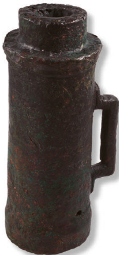
SL. 37. MUŽAR

Najbrojniji su ipak kameni projektili, kugle promjera u prosjeku 10 cm, dok su one većeg kalibra samo djelomično očuvane, razbijajući se tijekom napada na gradskom zidu.