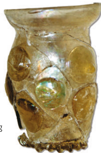
SL. 27. DIO ČAŠE TIPA KRAUTSTRUNK

U obliku je štita, sa središnjim prikazom ruke s turskom sabljom. Motiv desnice koja drži sablju čest je u Mađarskoj i Hrvatskoj. Kod nas se kao jedini središnji prikaz pojavljuje na grbu dalmatinske obitelji Božić koja vjerojatno pripada redu novovjekovnog vojnog plemstva.