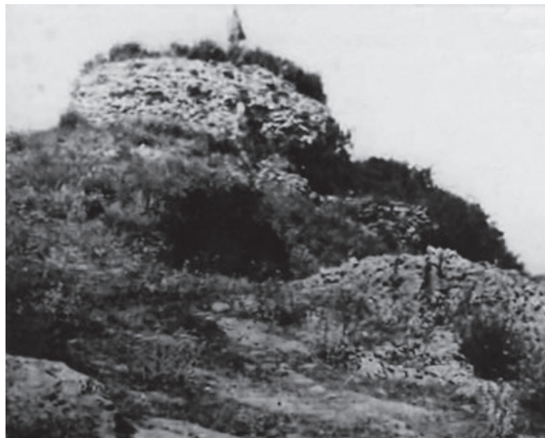
SL. 2 POGLED NA KULU, PRVA POL. 20. ST.

Isprava je pisana u nekom tornju koji se nalazi na Udbini, u kojem bi lako mogli prepoznati kulu kao začetak novog naselja kojeg podiže rod krbavskih knezova Kurjakovića, suverenih gospodara župom Krbavom. Kurjakovići su od kraja 13., a osobito tijekom naredna dva stoljeća, izrazito ekonomski moćna i politički utjecajna plemićka obitelj. Svoje posjede šire ženidbenim vezama, kako s Nelipićima, tako i