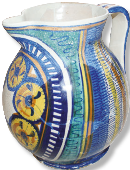
SL. 23. REKONSTRUIRANI MAJOLIČKI VRČ

majolike koja se uvijek odlikuje visokom kvalitetom, fino pročišćenom glinom i vrsnošću izvedbe, a rezultat su trgovačkih veza sa susjednim, italiskim i nešto udaljenijim španjolskim prostorom. Rekonstruirani vrč s trolisno izvedenim otvorom, koji pripada majolici strogog stila, njezinoj cvjetno-geometrijskoj grupi od druge polovice 15. i početka 16. st., povezuje uz radionice grada Faenze u Romagni čije proizvode nalazimo osobito na zadarskom području. Na obje strane premazan bijelom kositrenom glazurom, a potom oslikan kobaltno plavom bojom, uz dodatak žute,