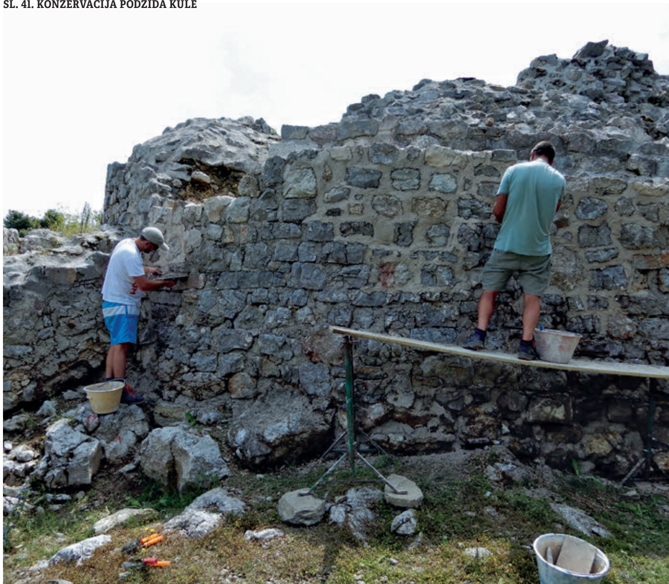
SL. 41. KONZERVACIJA PODZIDA KULE