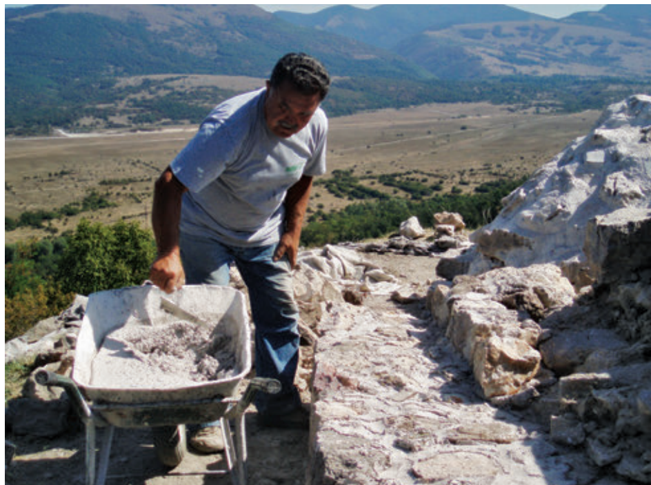
SL. 40. REKONSTRUKCIJA VANJSKOG LICA KULE

pokazuju da je gradnja vođena ponajprije obrambenom namjenom, dok su ostale zidane strukture nastajale shodno trenutnoj ratnoj opasnosti i/ili operacijama te u skladu s njima, i potrebama. No, prema pokretnoj arheološkoj građi, osim vojnog karaktera, Udbina je predstavljala i stambeni reprezent moći vlasnika grada, Kurjakovića. Iz repertoara nalaza, osobito uvezenog skupocjenog ansambla, vidimo krbavsku Udbinu u krugu istovremenih srednjoeuropskih utvrđenih gradova.