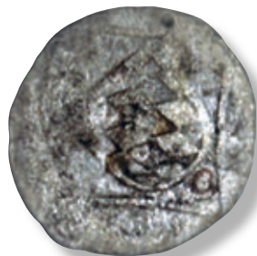
SL. 29. PFENIG ALBREHTA IV MUDROG (1505-1508.)

koji su nam pokazatelj korištenja gradinskog prostora zasigurno kao osmatračnice u rimsko doba, pronađeni su pfenizi (Bavarska, Austrija) i žeton druge polovice 15. i 16. st.