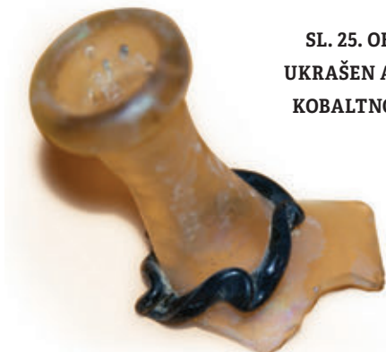
SL. 25. OBOD I VRAT BOCE UKRAŠEN APLICIRANOM NITI KOBALTNO PLAVOG STAKLA

Ulomci stakla, osim neznatnih primjeraka prozorskih okulusa , pripadaju različitim gotičkim čašama, manje bocama, zdjelicama ili peharima koji su tijekom 15. i 16. st. izrađivani u muranskim radionicama ili su proizvod njemačkih, tzv. šumskih staklana. Osobito su poznate radionice na području gorja Spessart u zapadnoj Njemačkoj koje djeluju u kasnom srednjem i novom vijeku.