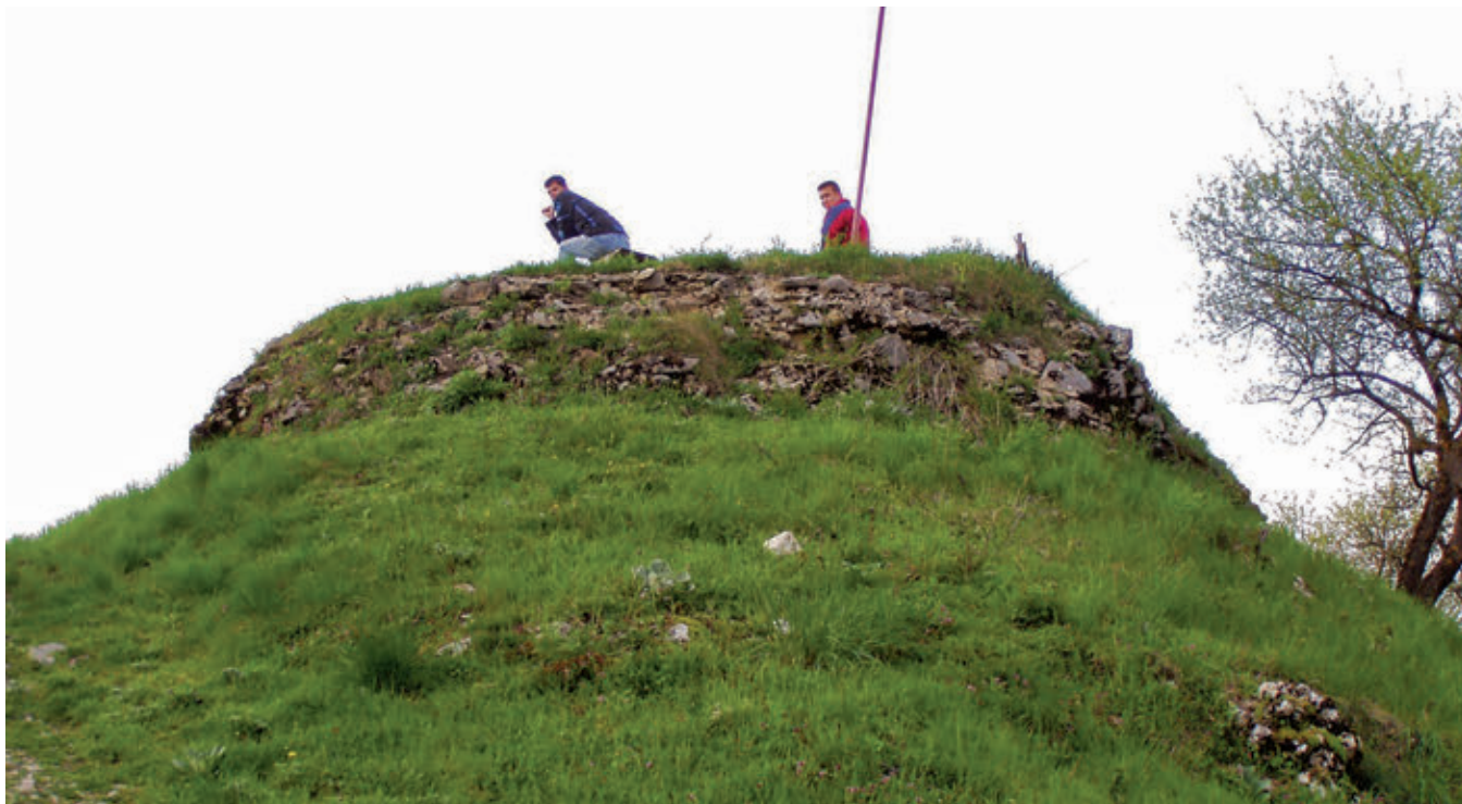
SL. 3. KULA PRIJE ISTRAŽIVANJA 2006.

Od 15. stoljeća, u trenutku kad je osmanlijska najezda već posve blizu, u Bosni, uz povremene pljačkaške pohode koji rezultiraju paležom i posvemašnjim prisustvom straha i nestabilnosti i konačno, prijenosa biskupske stolice u Modruš 1460., podignuto je utvrđeno naselje sa središnjom kružnom kulom na najvišoj točki. Ovaj je prostor zaštićen obrambenim bedemom i tvori sam palas nekadašnjeg grada. Na njegovoj istočnoj i južnoj strani, također zaštićeno drugim prstenom bedema, nalazi se podgrađe, koje