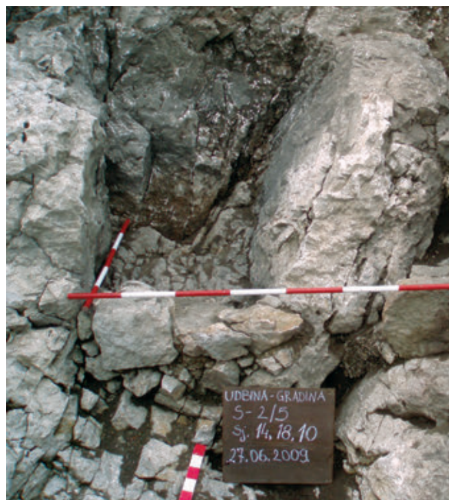
SL. 12. OGNJIŠTE U ŽIVCU KAMENU