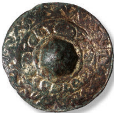
SL. 31. POZLAĆENA BRONČANA APLIKA