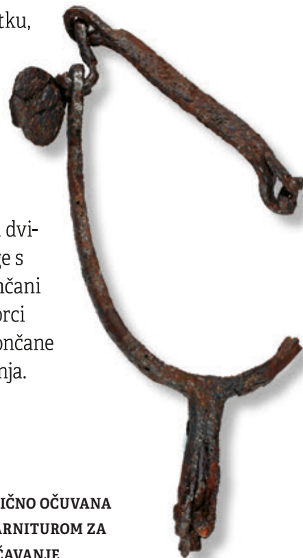
SL. 30. DJELOMIČNO OČUVANA OSTRUGA S GARNITUROM ZA ZAKOPČAVANJE

Konjaničkoj opremi pripadaju dvije željezne ostruge s kotačićem, a brončani lukovičasti praporci te pozlaćene i brončane aplikacije opremi konja.