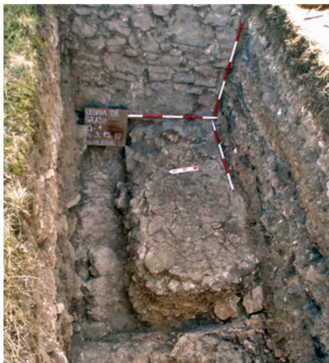
SL. 11. PODNICA UZ BEDEM NA SI

Kako bi se ublažila strmina prirodne padine rađena je nivelacija slojem nabijene žbuke i sitnog kamena, tvoreći plitke stepenice u svrhu ublažavanja