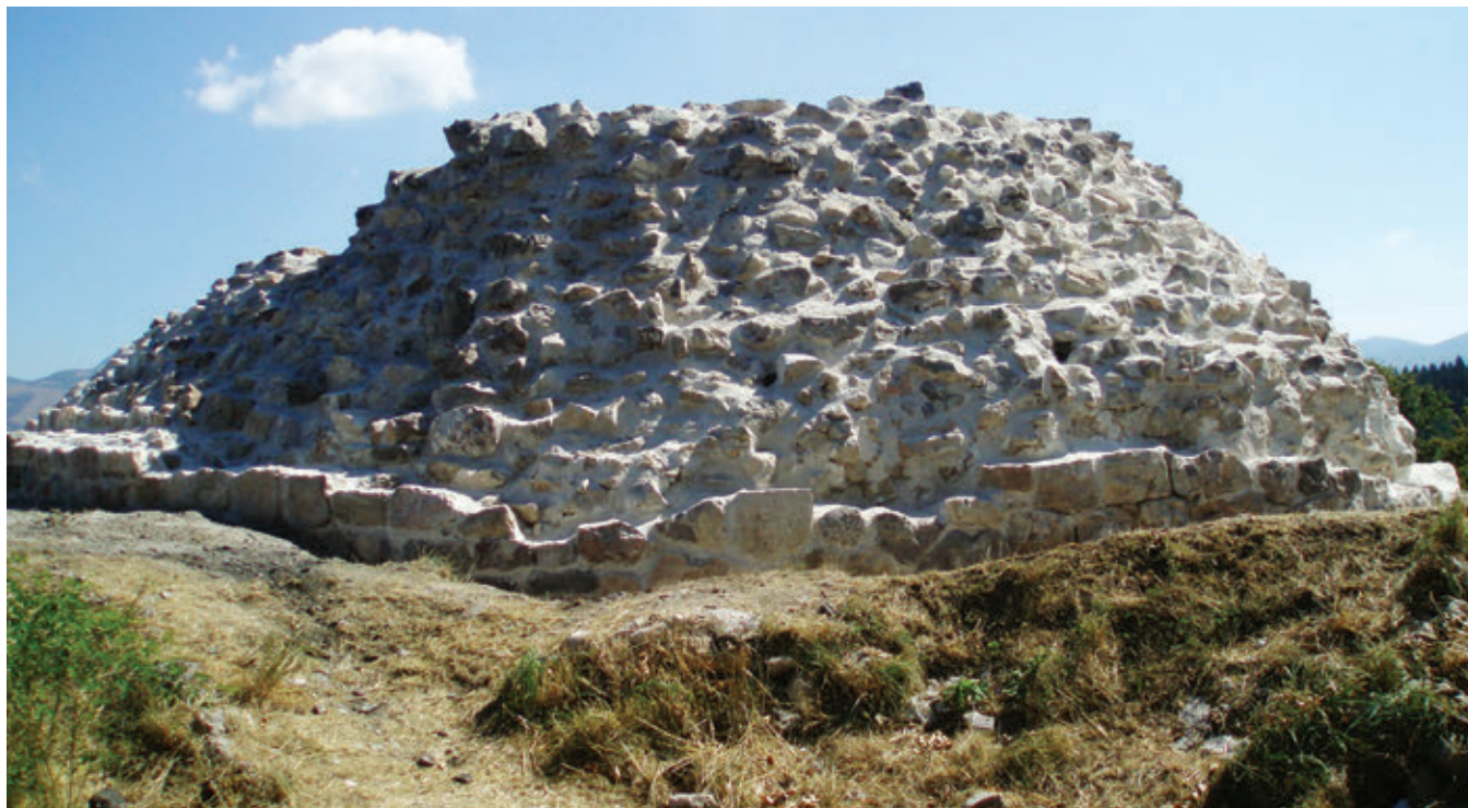
SL. 4. DIO ZAPADNOG PLAŠTA KULE

Frankopan senjskom biskupu Franji Jožefiću 1527. „ono ča smo imili u Hrvatih, to nam li savsema Turci razrobiše, pokli je Udbina vzeta.“