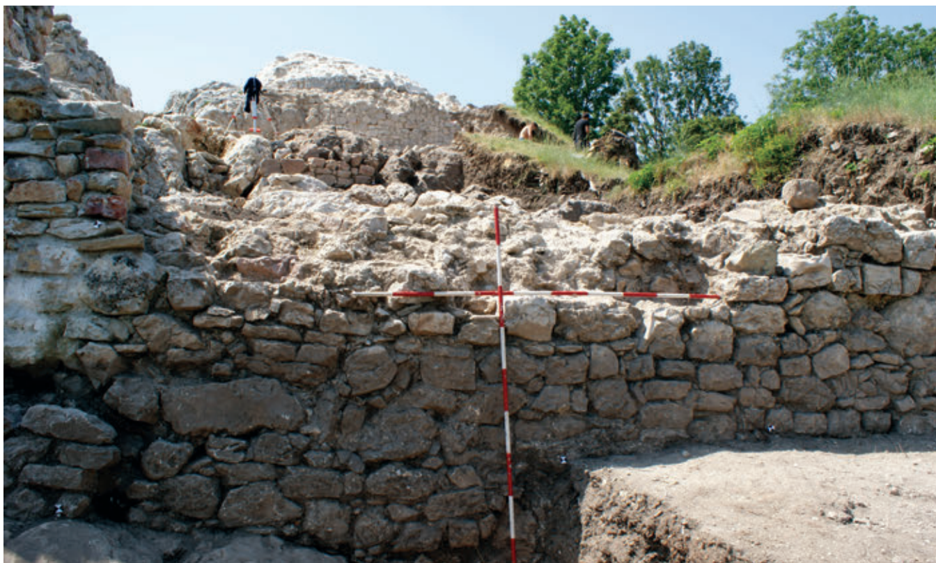
SL. 13. POGLED NA DIO SJEVERNOG BEDEMA I STRUKTURU VANJSKOG LICA

nagiba. Nivelacija leži na kamenu živcu, zapunjujući i prirodne rascijepu uzduž istočnog unutarnjeg bedema i očito se ovdje nalazila svojevrsna komunikacija. Uz sam ulaz i bedem otkriveno je četvrtasto ognjište, napravljeno u udubini kamena živca dodatnim otesavanjem triju ploha, dok je četvrtu stranu zatvarao tanji zid građen neobrađenim kamenom.