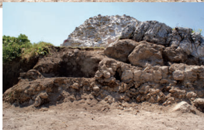
SL. 15. PROSTORIJA 2 („ZA STRIJELCA“) IZMEĐU KULE I ISTOČNOG BEDEMA

Na istočnoj strani, uz bedem podignuta je u jednom trenutku i manja obrambena struktura, prostorija 2. Loša gradnja nad slojem građevinskog urušenja ukazuje da je građena na brzinu, možda i tijekom napada, a prema vrhovima strelica i oraha za samostrijel, pretpostavlja moguću poziciju za strijelca.