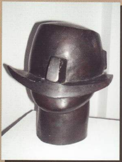
Ivan Kožarić: Ličanin, 1954.

Fundus Galerije posjeduje više od 700 umjetnina (slika, crteža, grafika i skulptura). Prilikom predstavljanja Spomenice Muzeja otvoren je 2008. godine privremeni Galerijski postav Iz fundusa Galerijskog odjela, 20. i 21. stoljeće, u kojem je izloženo 58 djela istaknutih umjetnika koji svjedoče o vrhuncima hrvatske likovne produkcije iz 20. i 21. stoljeća.