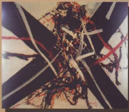
Edo Murtić: Susreti, 1978.

nastaje već u početku postojanja Muzeja Like Gospić i čini osnov Galerijskog odjela. U svom dosadašnjem djelovanju Galerija proživljava nekoliko transformacija. Otvorena je 11. travnja 1966. godine u dvije prostorije Muzeja kao Stalna izložba slikara Ličana. To je ustvari prvi fundus koji će se svake godine povećavati.