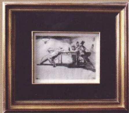
Miroslav Kraljević: U kavani, 1912.

Ubrzo nakon toga, održana je izložba radova slikara, grafičara i kipara nazvana Lički likovni anale. Ta tradicionalna manifestacija koja se održava i danas, postala je simbolom prezentacije dugogodišnje likovne kulture na ovim prostorima. Ovom likovnom smotrom i sustavnim otkupom, uz darovana umjetnička djela radala se i nastajala Prva lička galerija umjetnina.