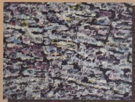
Oton Gliha: Gromače, 1975.

Galerija će nastojati i dalje zadržati istu izlagačku politiku, odnosno da se i nadalje svaka izložba popratí kataloški i da se dovede što više, kako mlade generacije umjetnika tako i onih koji su pronijeli slavu i afirmirali našu nacionalnu umjetnost.