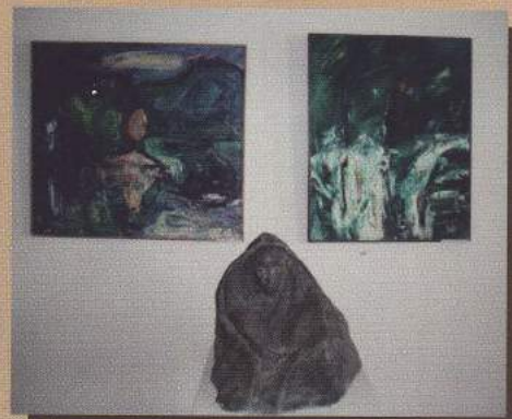
Detalj iz Galerije

Fundus Galerije posjeduje više od 700 umjetnina (slika, crteža, grafika i skulptura). Prilikom predstavljanja Spomenice Muzeja otvoren je 2008. godine privremeni Galerijski postav Iz fundusa Galerijskog odjela, 20. i 21. stoljeće, u kojem je izloženo 58 djela istaknutih umjetnika koji svjedoče o vrhuncima hrvatske likovne produkcije iz 20. i 21. stoljeća.